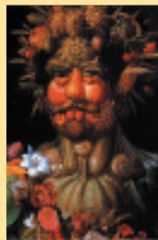
Arcimboldo « Le Vertumne » 1591