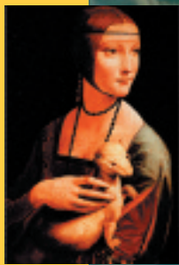
Léonard de Vinci « La Dame à l'hermine » 1490