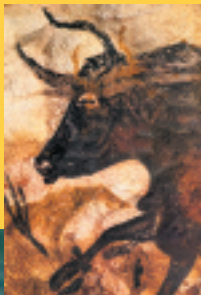
Grotte de Lascaux « Taureau noir » Paléolithique supérieur