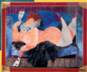
Golec & Golec « Entr'actes » 2001