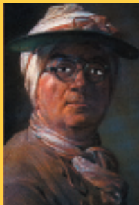
Jean-Baptiste Chardin « Autoportrait aux béquilles » 1775