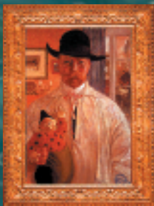
Carl Olaf Larsson « Autoportrait » 1906